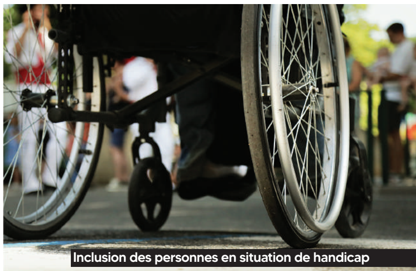
Inclusion des personnes en situation de handicap