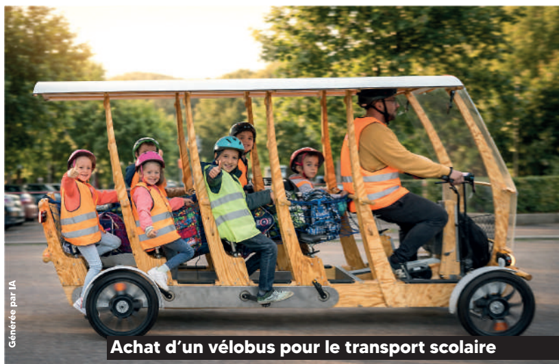
Achat d'un vélobus pour le transport scolaire