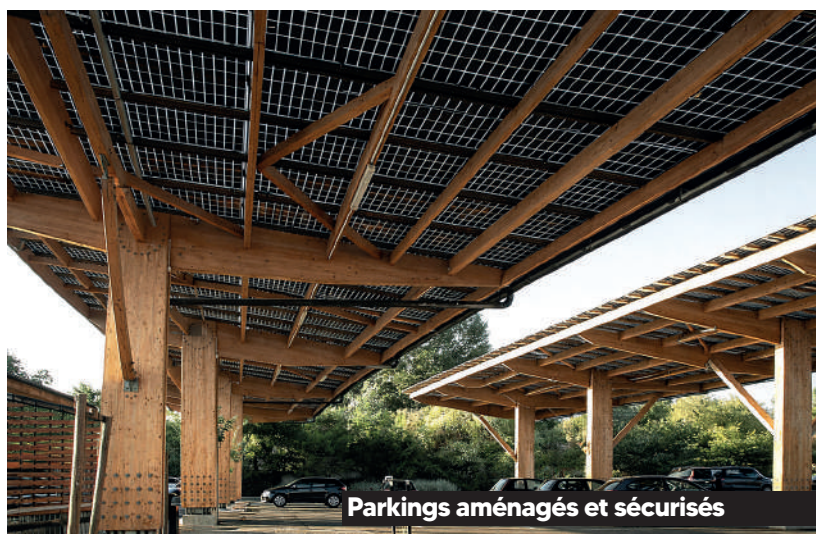
Parkings aménagés et sécurisés