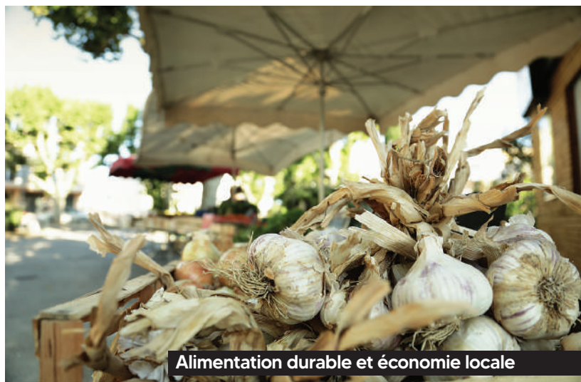
Alimentation durable et économie locale