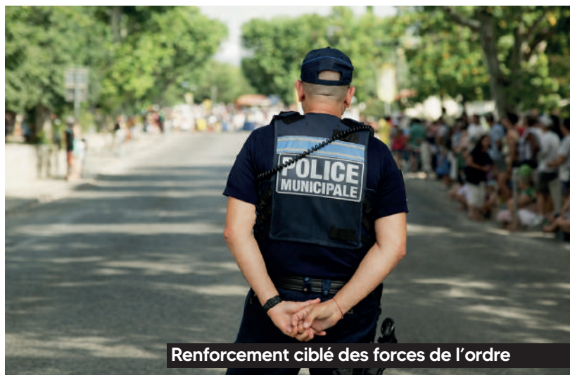
Renforcement ciblé des forces de l'ordre

► Prévention des incendies : création de zones agricoles coupe-feu, débroussaillage naturel grâce à l'agropastoralisme et exercices réguliers à l'échelle communale.