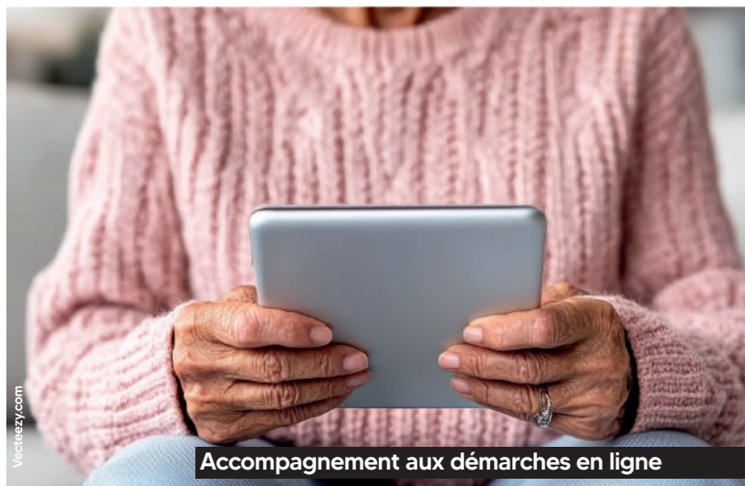
Accompagnement aux démarches en ligne