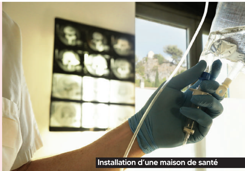
Installation d'une maison de santé