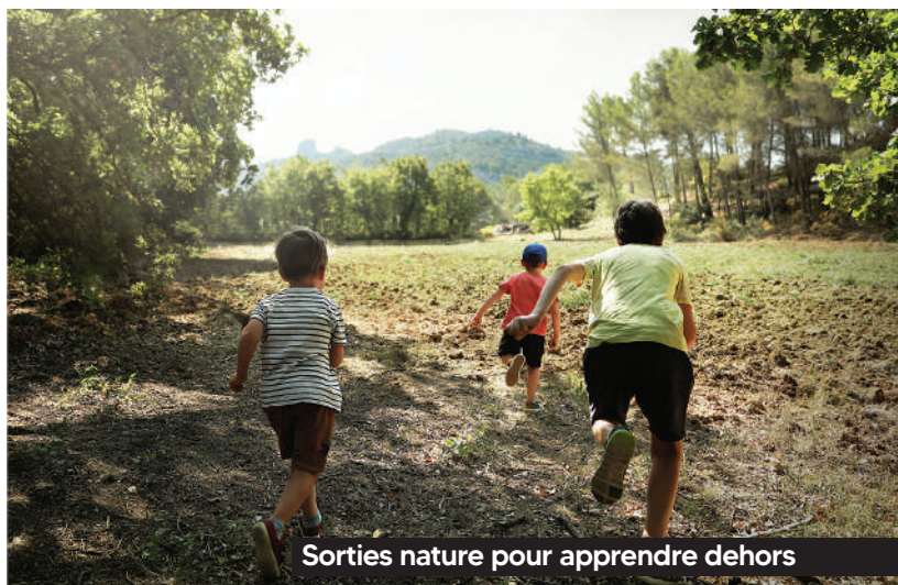
Sorties nature pour apprendre dehors

► Un véritable service de la petite enfance : soutien aux assistantes maternelles, animations dédiées, ludothérapie et accès à la culture dès le plus jeune âge en lien avec la nouvelle médiathèque.