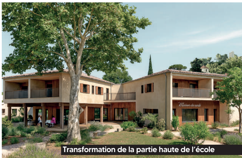
Transformation de la partie haute de l'école

► Transformation de la salle Léon Masson en médiathèque moderne et intergénérationnelle, ouverte à la culture, au numérique et aux animations variées.