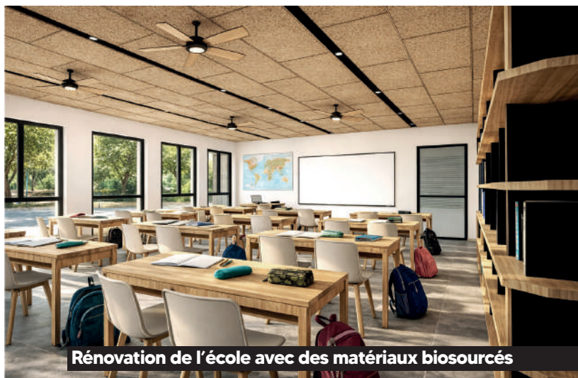
Rénovation de l'école avec des matériaux biosourcés