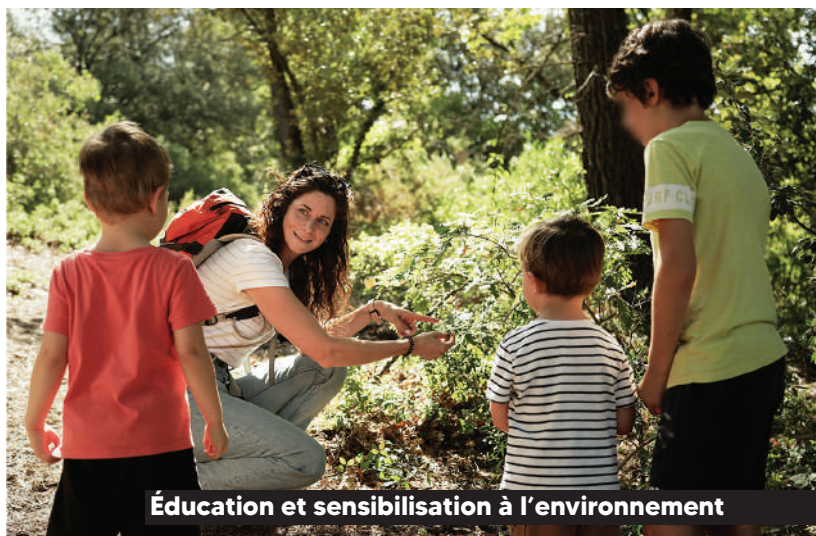
Éducation et sensibilisation à l'environnement