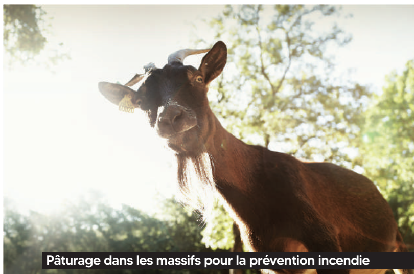
Pâturage dans les massifs pour la prévention incendie