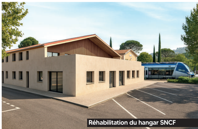
Réhabilitation du hangar SNCF

► Gestion des nuisances : installation de pigeonniers pour orienter les oiseaux et préserver l'espace public.