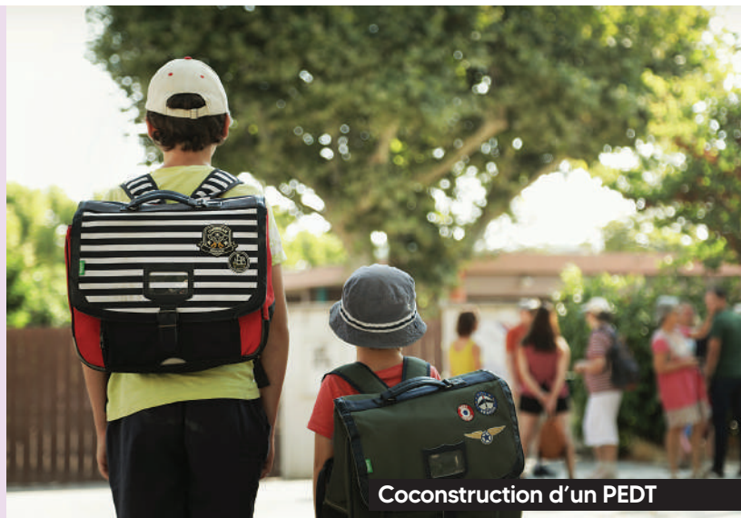
Coconstruction d'un PEDT