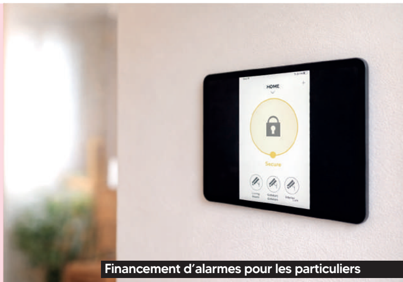
Financement d'alarmes pour les particuliers