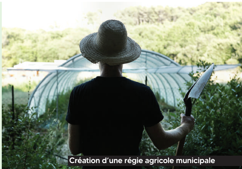
Création d'une régie agricole municipale