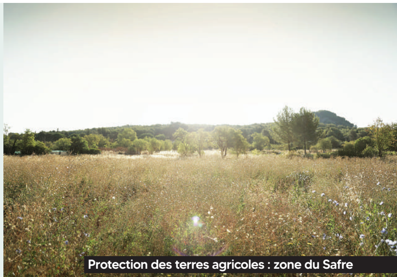
Protection des terres agricoles : zone du Safre