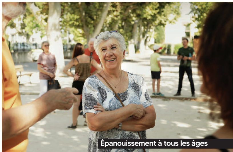
Épanouissement à tous les âges

► Bien vieillir à Simiane : activités de prévention, repas partagés, pratiques sportives, sorties culturelles et loisirs adaptés pour nos anciens.