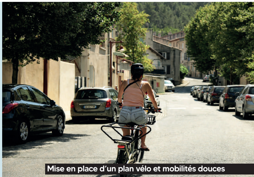
Mise en place d'un plan vélo et mobilités douces