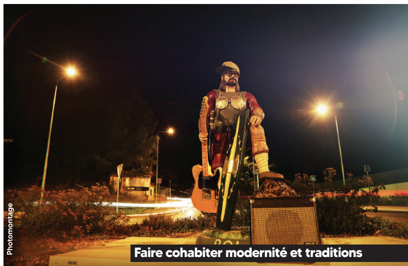
Faire cohabiter modernité et traditions

► Une pratique sportive fédératrice : semaine du sport et événements sportifs nature, pour les petits et les grands.