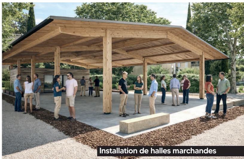
Installation de halles marchandes