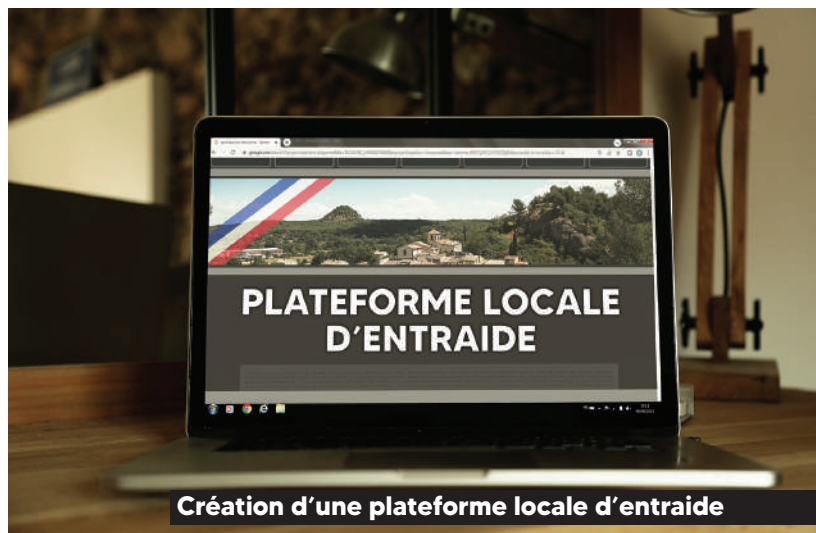
Création d'une plateforme locale d'entraide