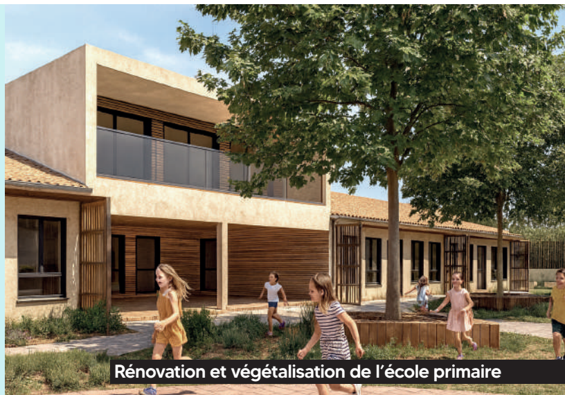
Rénovation et végétalisation de l'école primaire