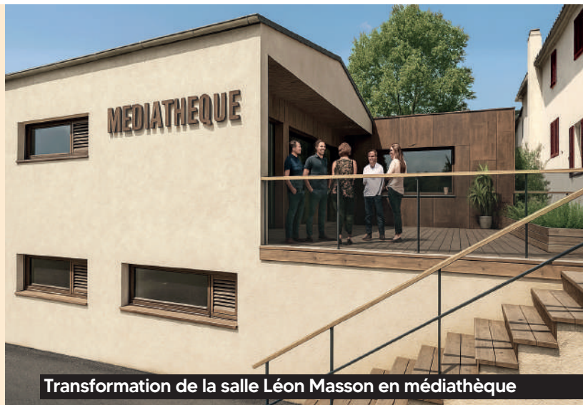
Transformation de la salle Léon Masson en médiathèque