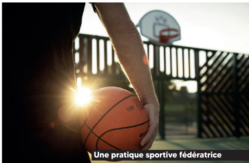
Une pratique sportive fédératrice